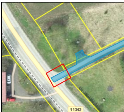
Joonis 1. Väljavõte EHRist

EHRis on sissesõidutee (EHR kood 221504509) ruumikuju näidatud terve ristumiskoha ulatuses (vt joonis 1 ).